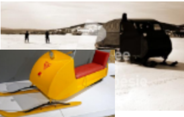
Motoneige de Bombardier vers le début des années 1960 le B-12 Bombardier

Il fut un temps où les hivers étaient plus froids et qu'une bonne partie de la Baie de Gaspé se couvrait de glace.